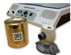
Abb.3 AUDIOCHARTA® compact mit Audiolent

Service-Telefon (kostenfrei): +49(0)800 – 159 258 0